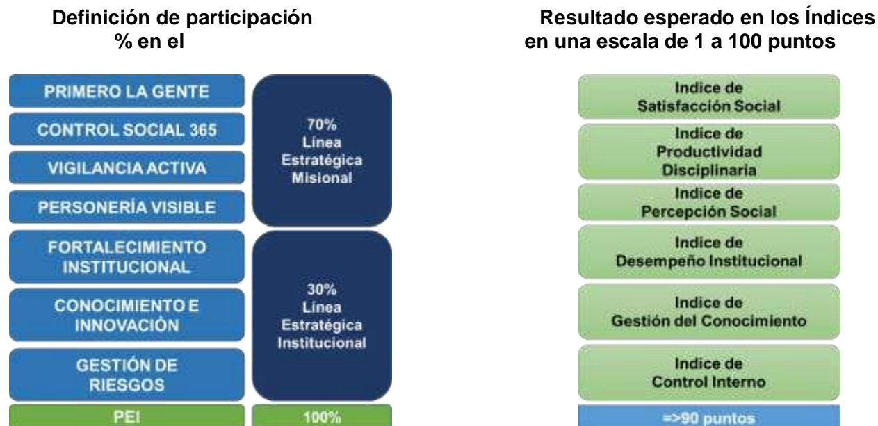
Tabla de Semaforización Metas y Programas del PEI