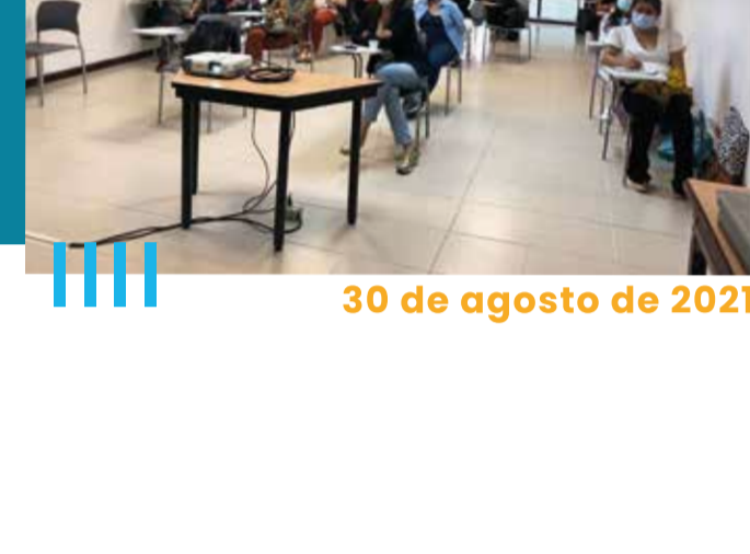
30 de agosto de 2021