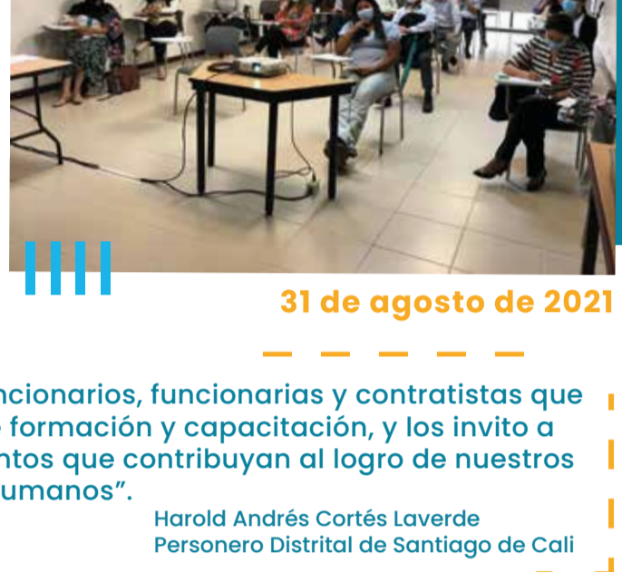
31 de agosto de 2021

"Quiero resaltar el compromiso de todos los funcionarios, funcionarias y contratistas que participaron activamente de estos espacios de formación y capacitación, y los invito a seguir ampliando sus habilidades y conocimientos que contribuyan al logro de nuestros objetivos como entidad garante de Derechos Humanos".