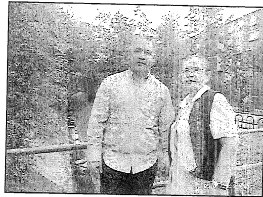
Visita Campo Enero 29 de 2026