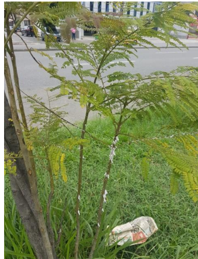
Presencia de Palomilla en los arbustos visitados