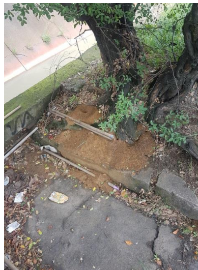
Presencia de Chinche y Hormiga Arriera en los arboles visitados